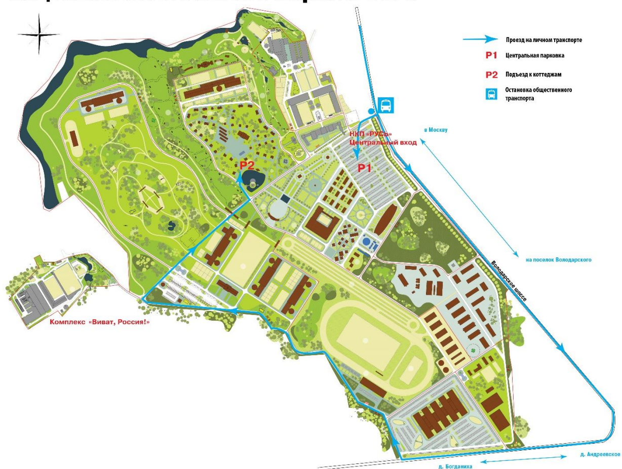
Схема проезда к коттеджному поселку на территории Национального Конного Парка «РУСЬ»